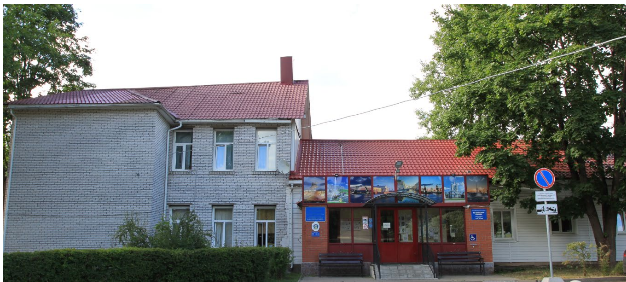
Фото. Здание ГБУ ЛО «СББЖ Всеволожского района».

В ГБУ ЛО "Станция по борьбе с болезнями животных Всеволожского района" в конце 2020 года создан и начал свою деятельность Инновационно-образовательный центр (ИОЦ), который предлагает широкий выбор тематических курсов рассчитанных на различный уровень подготовки слушателей. Основной задачей является обучение и развитие практических навыков, применение полученных знаний, умений в ежедневной профессиональной деятельности.