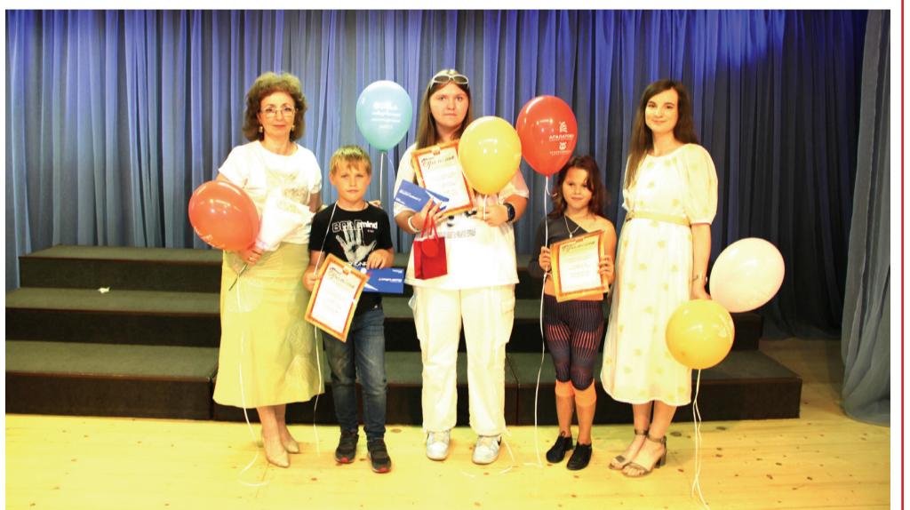
Фото культурно-досугового центра "Агалатово"