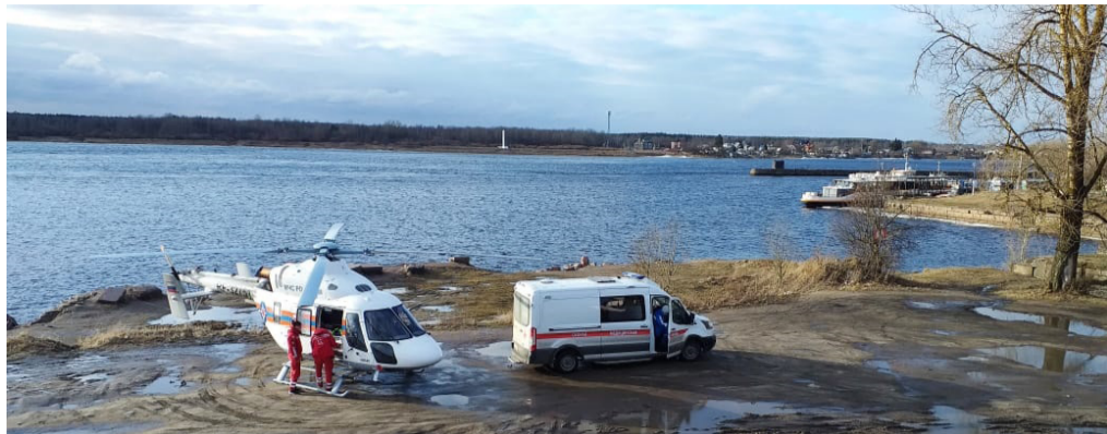
Санзадание, берег Ладоги